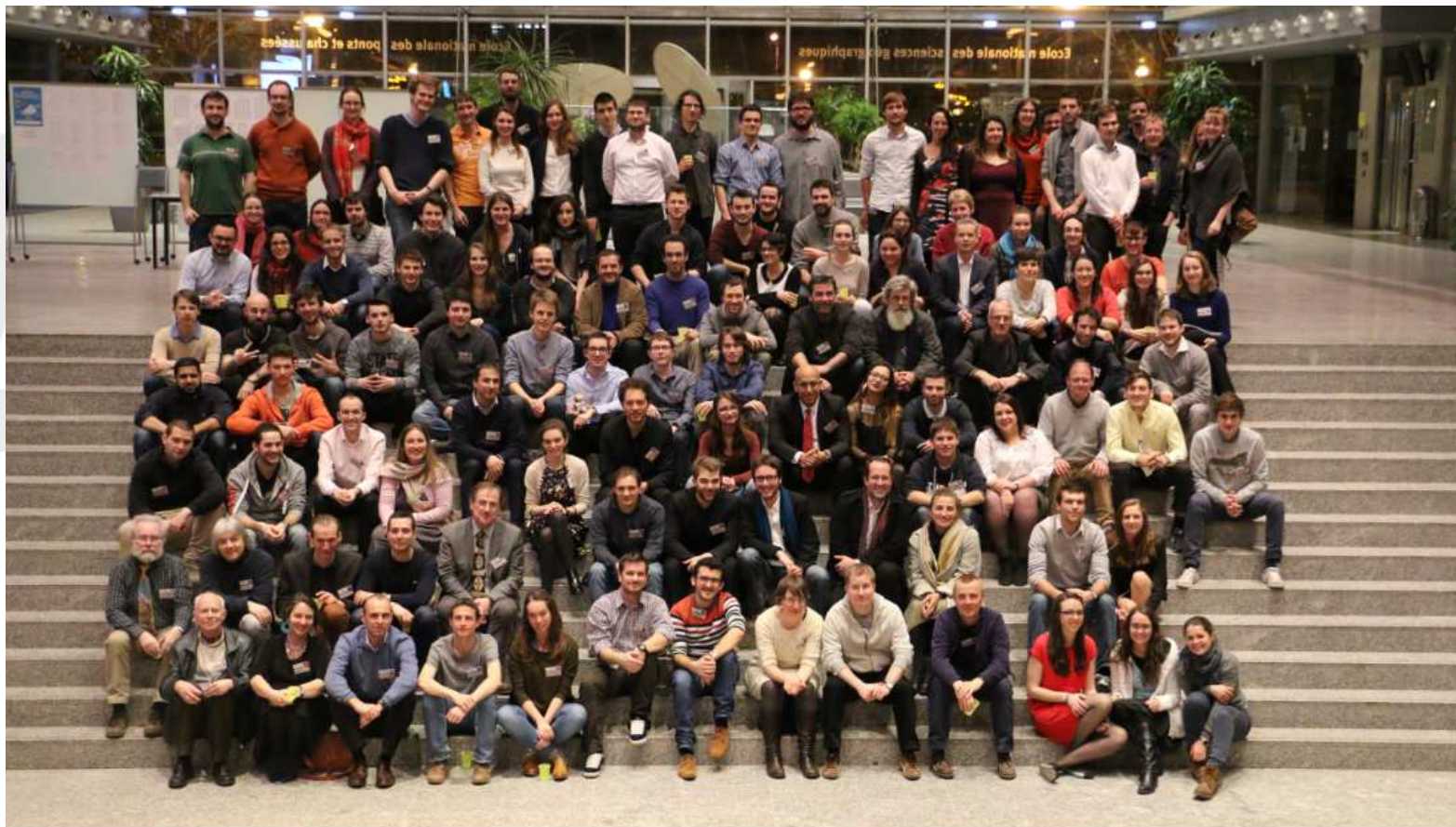
Rencontre du 11 mars 2016